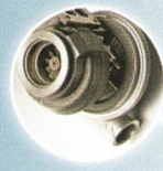
TURBO 2 000 € D'ÉCONOMIE